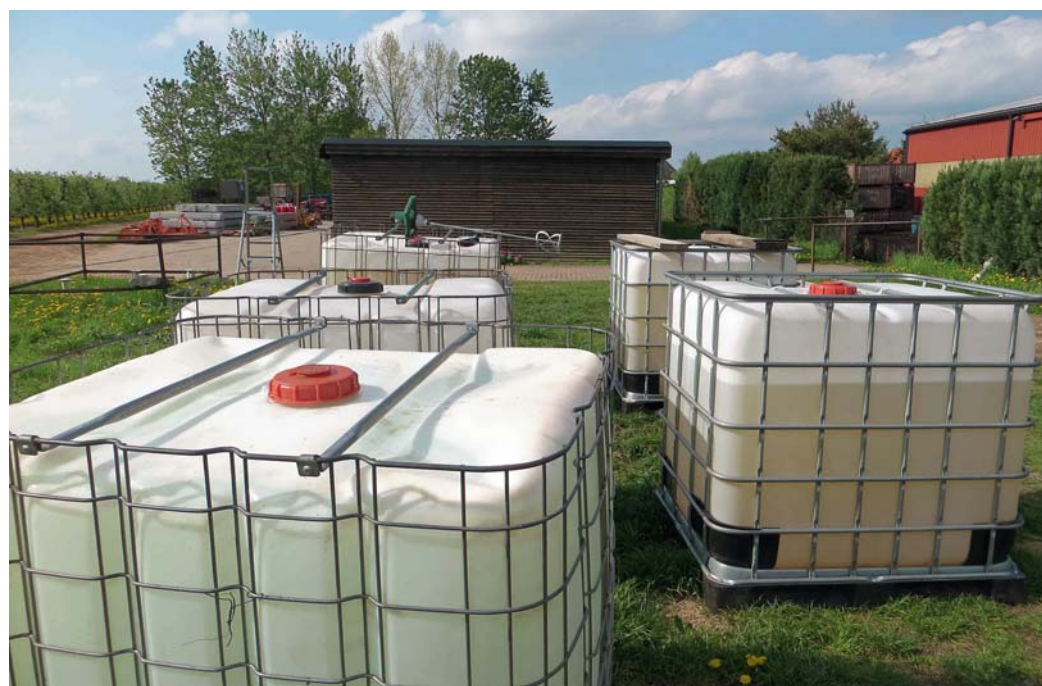
Im Vorfeld der LMA-Behandlung mussten sich die Brandenburger Betriebe 1.000 l-Gefäße sowie passendes Rührwerk beschaffen, um die Lösungen mit LMA herstellen zu können

Um eine mögliche Beeinträchtigung der Blüten bei Birnensorten zu klären, wurden