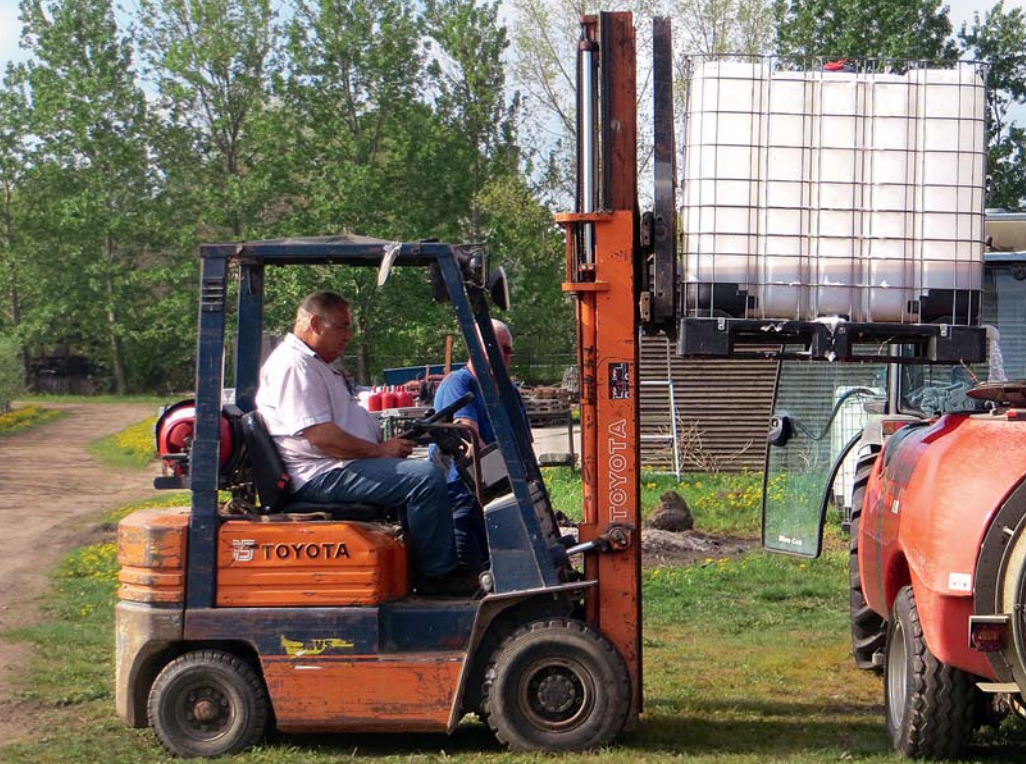
Befüllen der PS-Spritze mit geeigneter Technik auf einem Praxisbetrieb in Brandenburg